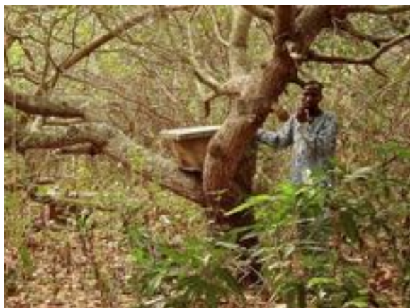
UNE RUCHE DE 2009

De la production à la vente, en passant par la fabrication des miels de diverses sortes, nous aurons accompli un de nos rêves avec nos amis béninois.